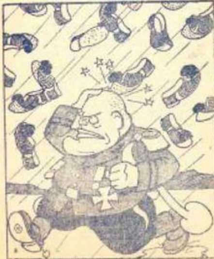
ΣΤΑΘΜΟΙ ΑΝΑΒΙΒΩΝ: Σάου, ού, βουρζ, νι, νι, κίτσα, ισάελο, πωλίκου, ού, τσ, Βάιτριν, Τετάνου